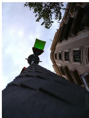
Figura 5. Semáforo en verde.

Para incluir la cita bibliográfica dentro del texto hay que seguir las mismas normas que en los demás documentos: apellido y año de creación. Deberá indicarse asimismo entre paréntesis «véase figura» y el número de la misma.